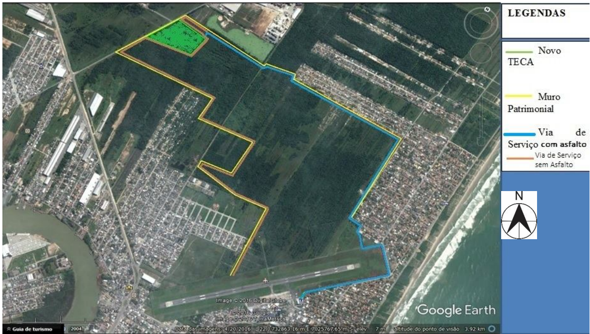
Figura 03: Localização da área no sítio aeroportuário.