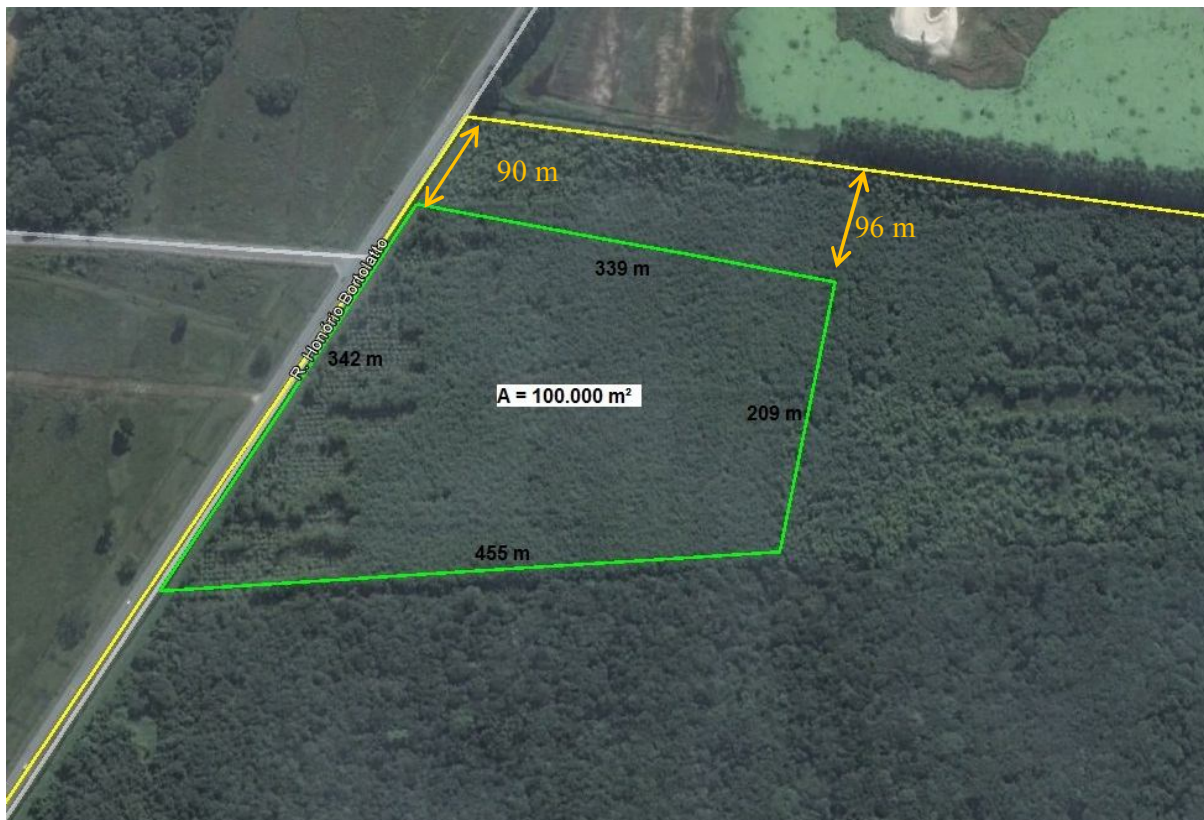
Figura 1 - Croqui de localização da área

Está localizado em área patrimonial do Aeroporto de Navegantes – Ministro Victor Konder, com frente voltada para a Rua Honório Bortolato, Bairro São Paulo – Navegantes/SC, conforme demonstrado em croqui abaixo: